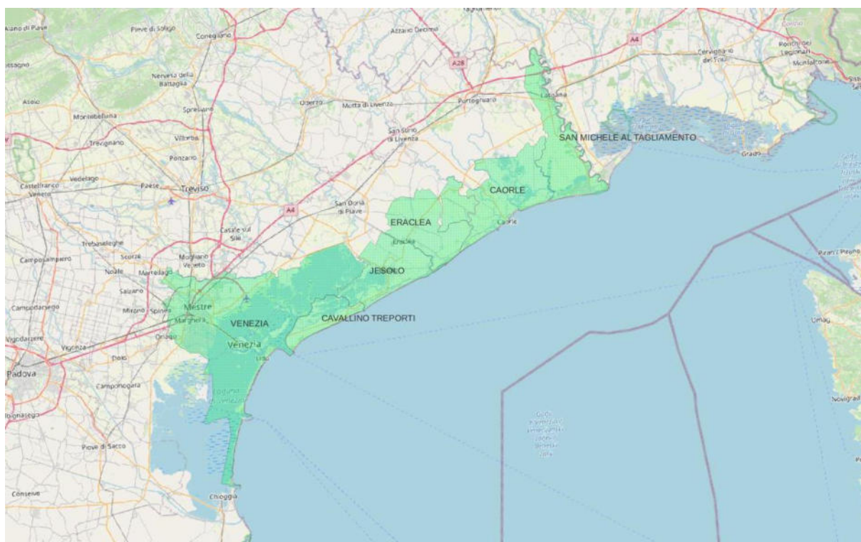
Fig. 1 – Ambito territoriale del PDA 2021/27 del FLAG Veneziano (elaborazione: Agriteco)

L'area interessata dal PdA del FLAG Veneziano comprende i comuni che si affacciano sul Compartimento Marittimo di Venezia: San Michele al Tagliamento, Caorle, Eraclea, Jesolo, Cavallino-Treporti e Venezia . Tutti i comuni interessati appartengono alla regione Veneto e alla città metropolitana di Venezia .